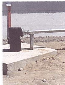
•Pozo APR Mallermo. •Perforación y entubamiento en 2018 DOH. •Habilitación Pozo Mallermo, postulado por el municipio a PMB – IRAL por $67.500.000. •Distribución de Agua Potable con Camión Aljibe.

Este proyecto permitirá extraer agua potable para ser repartida en camiones aljibes a la comunidad, pero indica que no es la solución óptima. Por lo tanto, lo que el municipio solicita al Consejo Regional, es poder conectar el pozo de Mallermo con un segundo pozo ubicado en Estadio de la localidad de Mallermo y de esta forma conectarlo a red, para llegar con esa agua hasta las copas del APR. El proyecto PMB que se está terminando, es el pozo de Mallermo cuya perforación y entubación se realizó en el año 2018 y la habilitación del pozo el cual fue un proyecto postulado por el municipio en conjunto con la DHO, lo que significa una mejor distribución de agua potable en camiones aljibes, lo que para el municipio no es lo óptimo, aclara el profesional. Lo que el APR está haciendo es sectorizar el suministro de agua y que solo es para los sectores bajos, para lo cual el municipio aporta con dos camiones aljibes para la distribución de agua en conjunto con los dos camiones de ONEMI, los que hacen una suma de mil litros de agua distribuidos en domicilios con arranque y sin arranque de agua potable. Esto significa que en las viviendas ya no hay agua potable saliendo por las llaves.